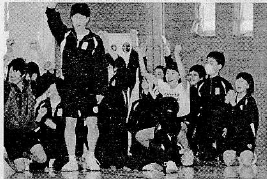
1・2年生学年レク大会 大いに盛り上がりました。