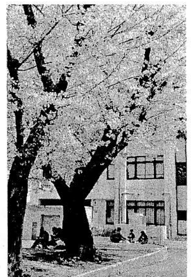
満開の桜の下で談笑する生徒