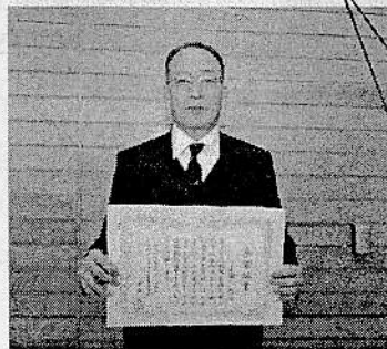
3月24日(金) 生徒会長から上叡 校長先生へ教師と しての卒業証書が 授与されました。