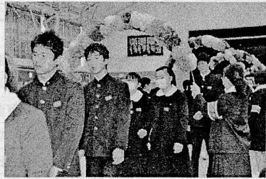
3月9日 3年生を送る会 70年の歴史を次へ