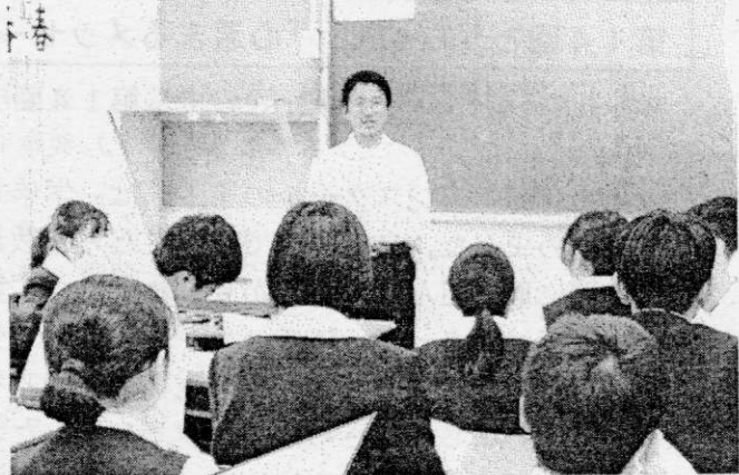
13日（木）の専門委員会は、3年生と活動できる最後の委員会活動となりました。学校全体のために、一生懸命活動してくれた3年生の姿は、1・2年生に眩しく映っています。