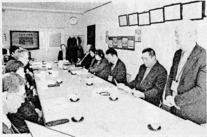
7日（金）本年度2回目となる「学校評議員連絡会・学校関係者評価委員会」と「健全育成懇談会（東中SSN）」を開催しました。皆様からいただいた貴重なご意見は、今後の学校運営に役立ててまいります。ありがとうございました。

【お知らせ】 ・卒業式については、13日（金）に卒業生、学校職員のみで実施します。 ・3月の学校給食については中止とします。 ・16日以降の予定については、新型コロナウイルス感染症の流行状況等を見極めたうえで判断し、学校のHPや安心メールにてお知らせします。