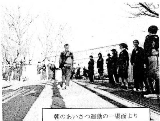
朝のあいさつ運動の一場面より

今後も教職員も含め、あいさつの励行に努めてまいります。ご家庭でもぜひご協力お願いいたします。