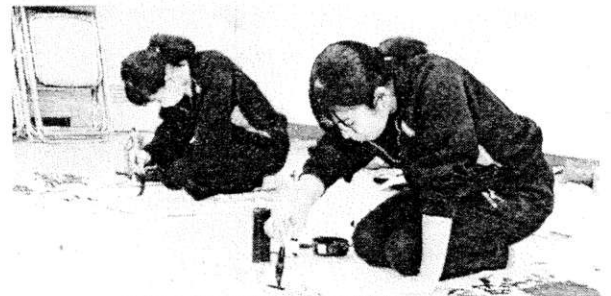
冬休み中の読書会の様子より。静寂と緊張感の中、黙々と文字と向き合う生徒たち。

新年を迎えるにあたり、子どもたちは今年の抱負や目標を新たに決意したことと思いますが、改めてその「目的」についても考えてほしいと思います。