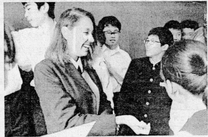
16日(月)、ブラジルから、高校生の留学生をお迎えし、G・Sの授業や給食、部活動などを通して楽しく交流しました。