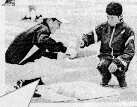
26日(木)、年内最後の部活動では、校庭を使う部活動の生徒たちが、凍結防止や吸湿効果のある塩化カルシウムを皆で協力して撒いてくれました。