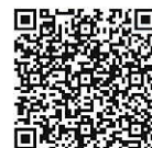
市HP「がん検診等のご案内」QRコード

※ 受診できる医療機関、検診内容は、市報4月号と同時配布した冊子「2019年度健康診査のお知らせ」または市ホームページをご覧ください。（「さいたま市 健康診査」で検索）